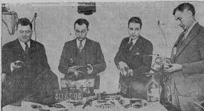
Este cuarto en la ciudad de Nueva York estaba bien provisto de municiones y otros artículos del arsenal Nueva York. Los investigadores, balas, amonico y otros artículos del arsenal Nueva York denunció la habitación a la policía