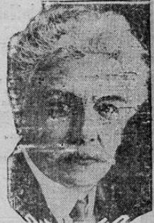
Según las noticias recibidas de Moscú, Clemencé Voroshilov, Comisario de Guerra y Marina del Soviet, se declaró dictador proponiendo a través de la radio; pero, al mismo tiempo, pidió a los habitantes de Rusia que permanecieran fieles al actual gobierno.