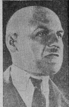
El camarada N. B. Krilenko, fiscal jefe de las repúblicas socialistas del Soviet, dirige el sensacional proceso de espionaje en Rusia, al cual se dice que están ligados varios gobiernos extranjeros, incluyendo la Gran Bretaña y Francia