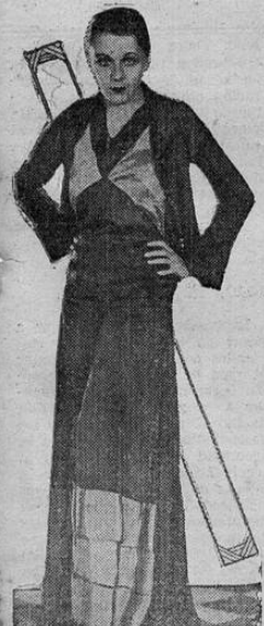
Un nuevo estilo de traje pijama de satén crepé negro. El pijama termina en tres vuelos de satén verde. La chaquetilla es corta en forma de bolero